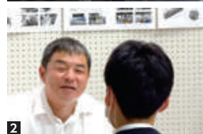
1 修理作業をする社員 2 合同会社説明会で求職者に熱心に説明する長吉社長