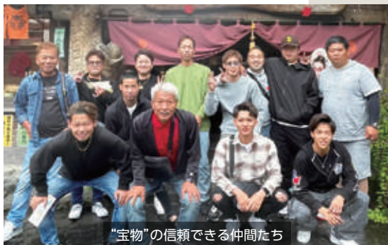
“宝物”の信頼できる仲間たち