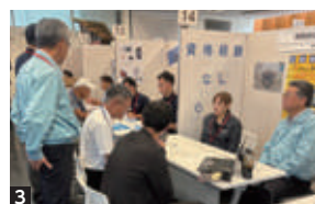
1 2 電力の安定供給を支えるためさまざまな現場でスタッフが活躍 3 ブースを訪れる参加者に、熱心に説明を続ける