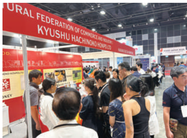
福岡県からも事業者が参加したFood Japan

また賃上げの原資を確保するためには、生産性向上や業務効率化が求められます。これらに役立つ補助金や助