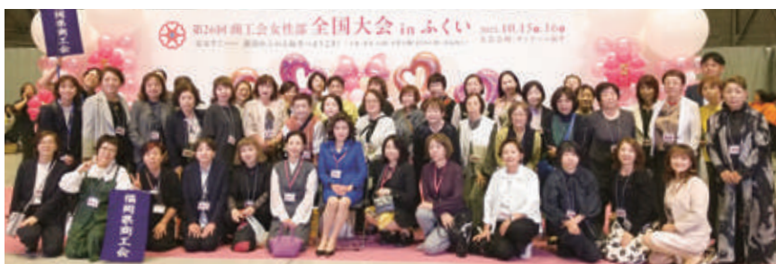
全国大会に張り切ったぞんだ商工会女性部員

この大会を通して、女性部員同士の絆がさらに強まり、今後も地域活性化に向けて一丸となって取り組むことを誓い合いました。