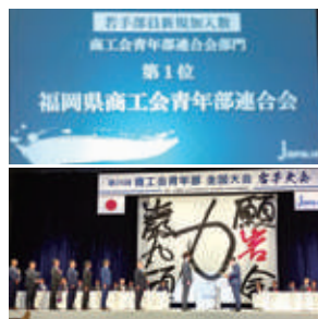
福岡県商工会青年部連合会が「若手部員加入実績の青年部連合会部門」で全国1位に